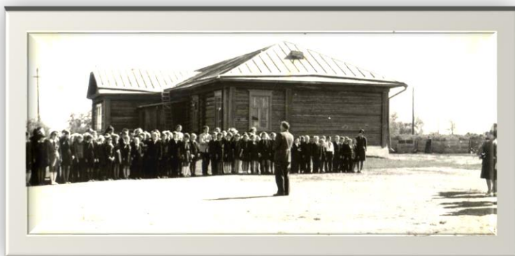
Общешкольная линейка Власихинская средняя школа Фото 1970-х гг.