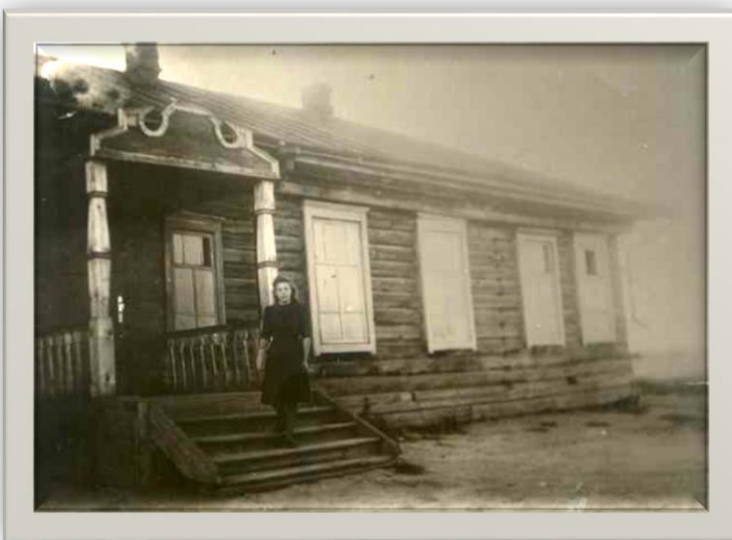
Здание школы села Власиха, построенное в 1892 году Фото первой половины XXв.

Строительство было начато в 1892 году и к осени было завершено. Здание было деревянным, находилось в центре села и на первых порах вмещало всех желающих обучаться.