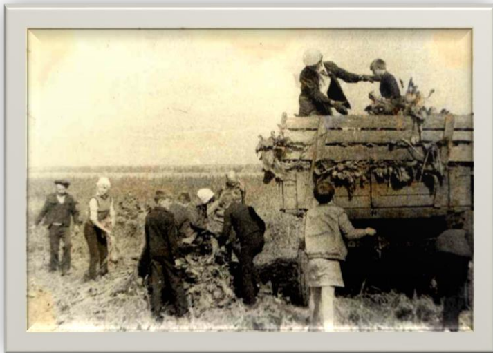
Власихинские школьники на уборке сахарной свеклы Фото 1960-х гг.

Для проведения практических занятий по изучению сельскохозяйственных машин УЧХОЗ выделял школе необходимую технику и опытного руководителя. Под его руководством мальчишки-старшеклассники не только теоретически знакомились с сельскохозяйственными машинами, но учились работать на них, а учащиеся 10-го класса получали необходимые знания и умения для самостоятельной работы на тракторах.