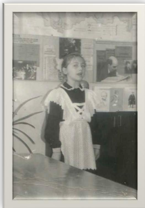
Власихинская средняя школа Фото 1980-х гг.