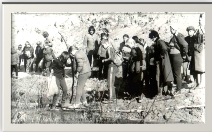
Традиционные «маёвки» - общешкольные походы на р. Барнаулку Фото 1970-х гг.