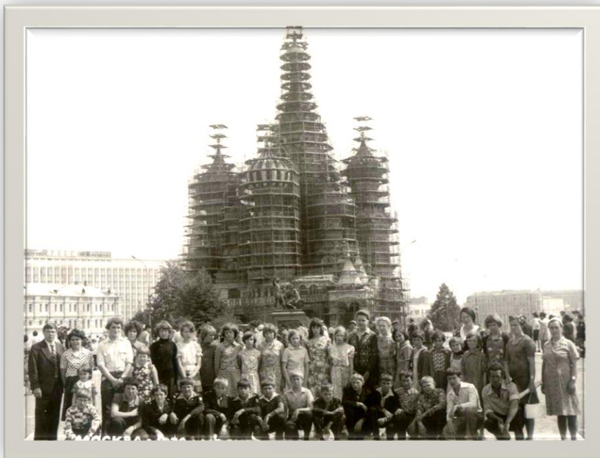
Ежегодные поездки на летних каникулах в Москву и в города-герои Советского Союза Учащиеся власихинской школы в г. Москва Фото 1979 года