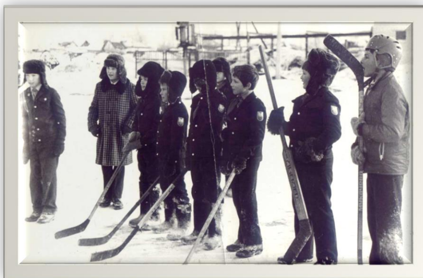
Учащиеся власихинской средней школы Фото 1970-х гг.