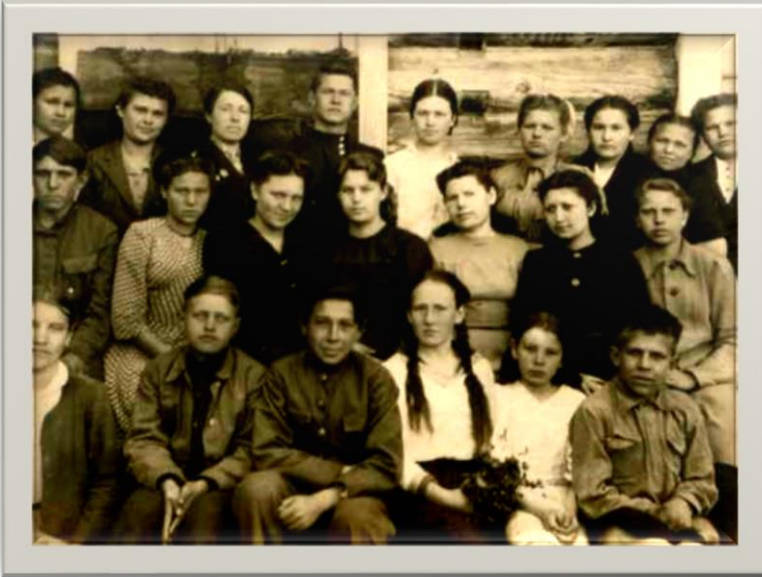
Семилетняя школа Село Власиха Фото 1946 года