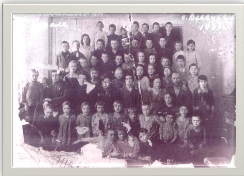
Семилетняя школа Село Власиха Фото 1933 года

24 декабря 1917 года «О передаче дела воспитания и образования из духовного ведомства в ведение народного комиссариата по просвещению» церковная школа была ликвидирована. В годы советской власти ставилась задача борьбы с неграмотностью. Коренная ломка школьной системы и попытка построить её на новых основах была предпринята в 20-е гг. В результате принятия ВЦИК 16 октября 1918 г. «Положения о единой трудовой школе в РСФСР», появился новый тип образовательного учреждения – «единая трудовая школа». В школе большее внимание уделялось практической, трудовой направленности обучения. Трудовая деятельность в самом широком понимании становится приоритетным направлением развития советской школы.