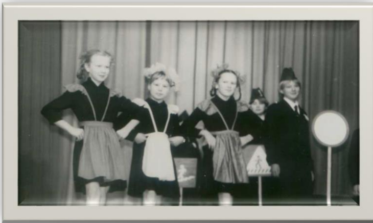
Власихинская средняя школа Фото 1970-х гг.