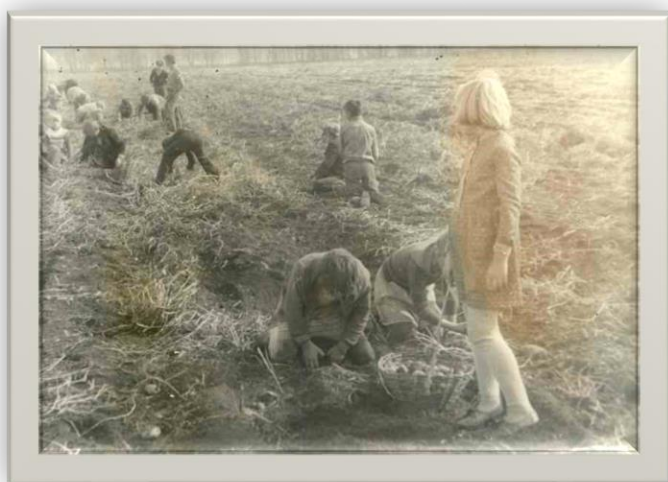
Власихинские школьники на копке картофеля Фото 1950-х гг.