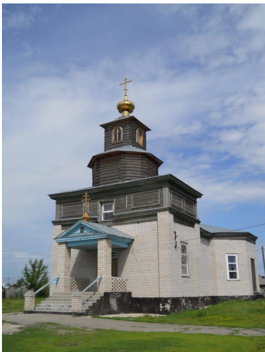
Церковь Казанской иконы Божией Матери Село Власиха Фото 2011 года

В 1901 году в селе Власиха строится церковь в честь Казанской иконы Божией Матери и школа становится церковно-приходской.