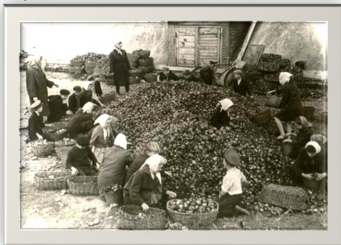
Власихинские школьники на переработке картофеля Фото 1950-х гг.

Положительным был также первый опыт проведения практикумов в VIII—X классах. Во многих сельских школах они организовывались при помощи МТС, колхозов и совхозов. В начале 1956 года Алтайский крайисполком принял решение о создании овощемолочного совхоза "Пригородное". Весной 1957 года к совхозу присоединили колхозы сел Власиха, Бельмесево, Гоньба, Лебяжье. "Пригородное" стало крупным хозяйством - 31 тысяча гектаров земель, из них 17 тысяч гектаров пашни. А через год на его базе было создано учебно-опытное хозяйство (УЧХОЗ) Алтайского сельскохозяйственного института "Пригородное". Вот здесь не одно десятилетие и проходили практику трудового обучения власихинские школьники. Средние классы регулярно привлекались на копку картофеля, прополку и сбор сахарной свеклы, к другим видам сельскохозяйственных работ.