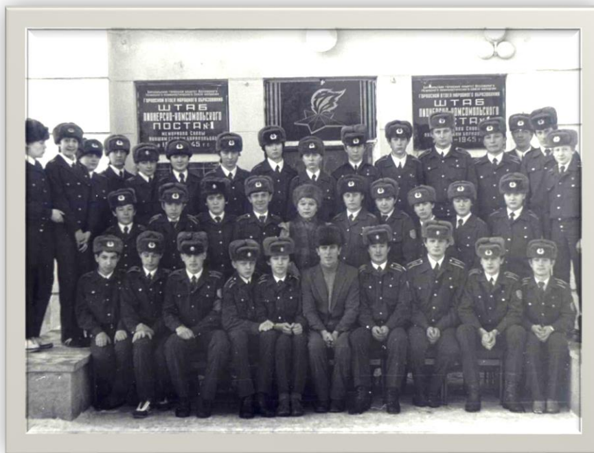
Фото 1980-х гг.

Школа была активной участницей почетной Вахты № 1.