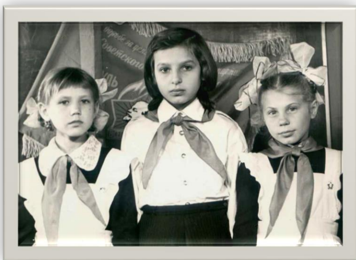
Члены пионерского отряда Власихинская средняя школа