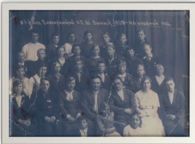
7-й класс Власихинской НСШ Выпуск 1939-1940 гг.

В годы войны произошли коренные изменения в системе образования. Учебные планы были приведены в соответствие с требованиями военного времени. Главное место принадлежало идейно-политическому, военно-патриотическому, трудовому воспитанию.