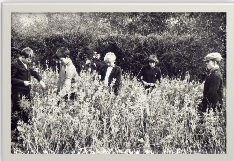
Школа села Власиха работа на пришкольном участке Фото 1960-х гг.

Для повышения эффективности воспитательного значения труда на пришкольном участке был организован постоянный уход за растениями в период летних каникул.