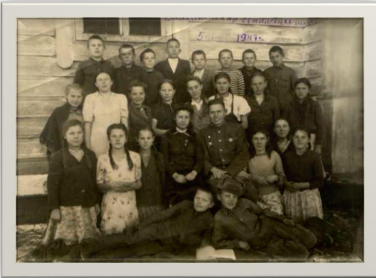
Семилетняя школа Село Власиха Фото 1947 года

Принимаются новые учебные планы, в которых упор делается на развитие политехнического образования, вводится физическая подготовка и труд. Школа призвана осуществлять задачу воспитания идеологически подкованного нового человека, преданного коммунистическим идеалам. В школьнике формируются чувство патриотизма, коллективизма, общественная активность. Советская школа в послевоенный период достигла впечатляющих успехов, несмотря на жесткий идеологический пресс и политику поиска “врагов народа”, коммунистической партии. Мероприятия, предпринятые правительством в послевоенное время, позволили советской системе образования создать базу для развития ее как одной из самых лучших в мире. Советское образование явилось базой для обеспечения производства квалифицированными кадрами в эпоху экономического подъема страны в последующие годы.