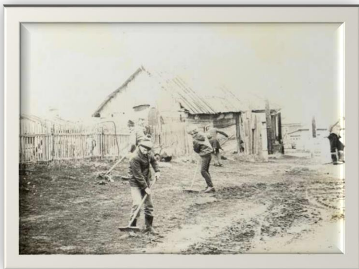
Работа тимуровцев с. Власиха Фото 1970-х гг.