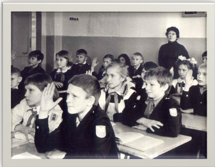
Учащиеся Власихинской средней школы Фото 1970-х гг.

Ученическая взаимопомощь, предметные вечера, общешкольные линейки, работа школьной редколлегии, сбор макулатуры и металлолома, субботние вечера, тимуровская работа, пионерские сборы, комсомольские собрания – то, чем жила наша школа в 70-80-е годы XX века.